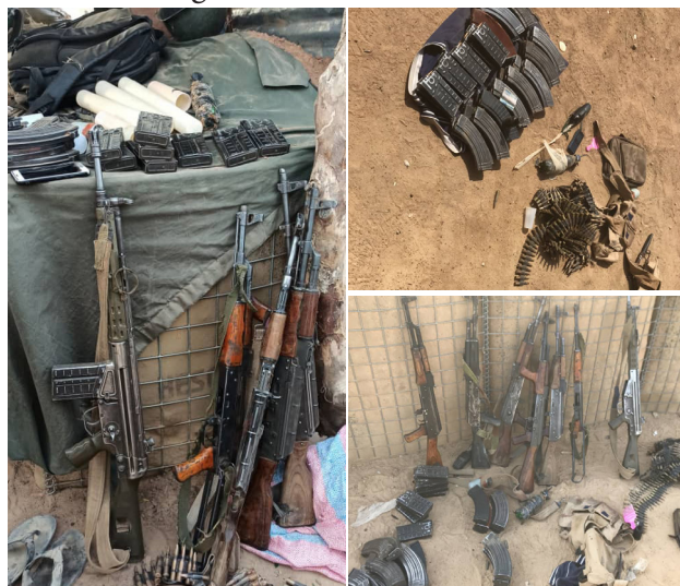
Un lot d'armement a été récupéré par le détachement de TANKOUALOU

Un militaire du détachement est malheureusement tombé au cours des combats. 03 autres soldats, blessés, ont été évacués par voie aérienne vers des structures médicales des Forces Armées Nationales.